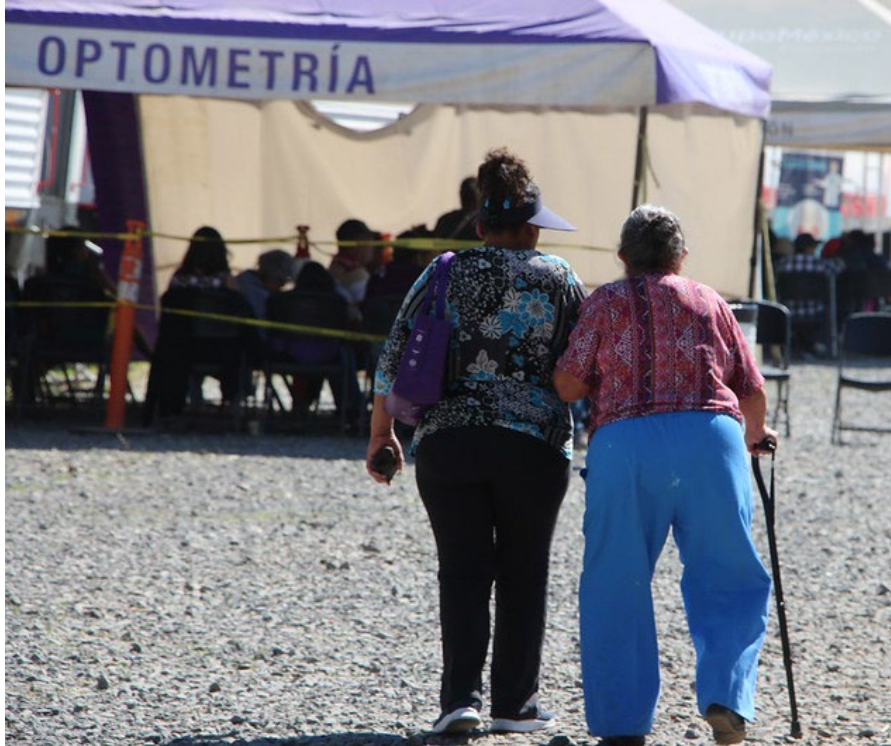
Las mujeres son las principales cuidadoras en la sociedad.

Necesitamos avanzar hacia sociedades en las que los cuidados sean colectivos y compartidos. Que sostener la vida sea motivo de unión y no de aislamiento. Que cuidar no implique sobrevivir sino vivir plenamente. Que cuidar de la otredad pueda existir con el cuidar de una misma. Sociedades en las que todas las personas podamos florecer.