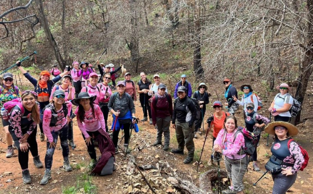
Senderos Rosas invita a conectar con la naturaleza y con el mundo interior.

El grupo inició hace tres años buscando el acercamiento y conexión con la naturaleza después del encierro por la pandemia por covid-19. Querían acercarse y acercar a sus conocidas a la vida outdoor , romper la barrera de ese lugar seguro en su casa y salir.