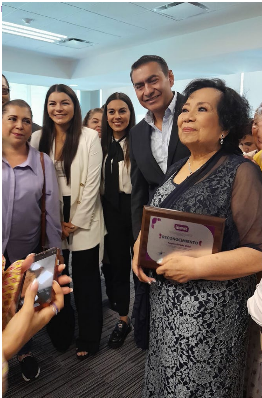
Amparo Ureña Vidal, expresidenta, fue reconocida por defender los derechos de las mujeres.